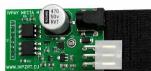
Paneloldal és csatlakozási környezet