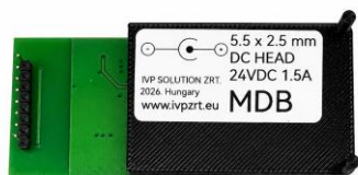
Címkeoldal: DC tápbemenet jelölés

Necta asztali automata vezérlés -> IVP MDB modul -> MDB fizetési egység. A modul az automata és a fizetési egység közötti MDB-kommunikációt biztosítja.